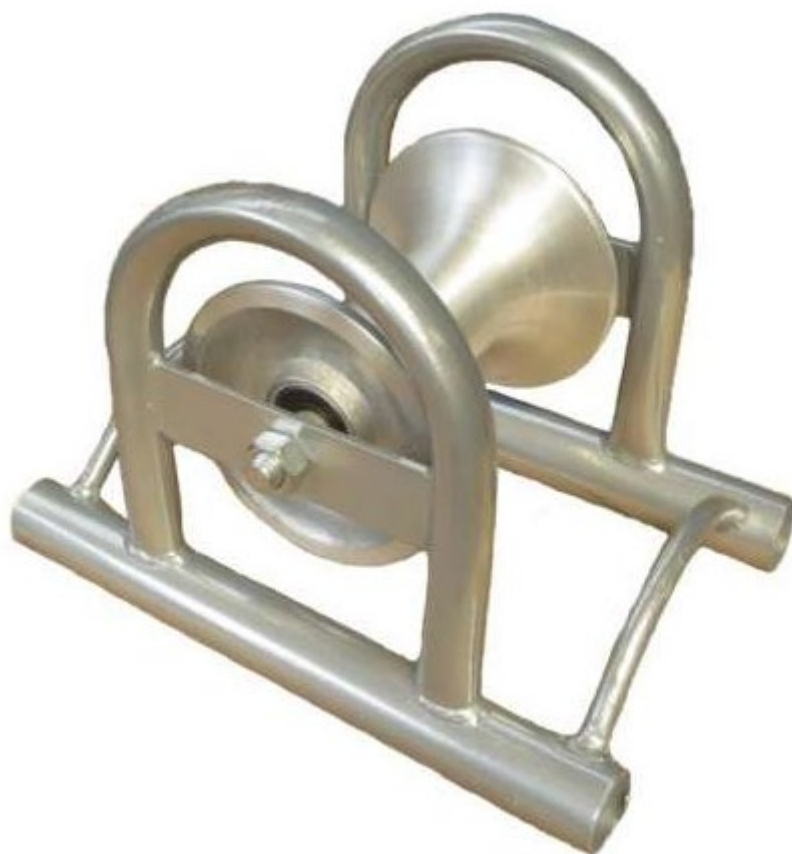
Ролик для прокладки кабелей